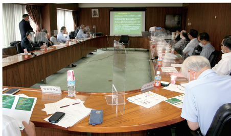
食肉学術フォーラム委員会の模様

〈本リーフレットは、令和4年8月18日および8月26日に開催された「食肉学術フォーラム委員会」の講演をもとに作成されました〉